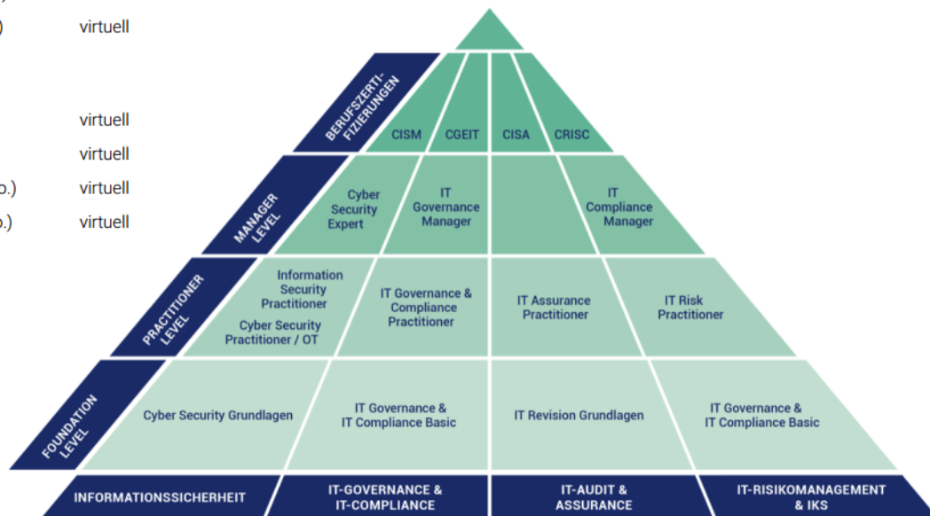
Ausbildungspyramide des ISACA Germany Chapter e. V.