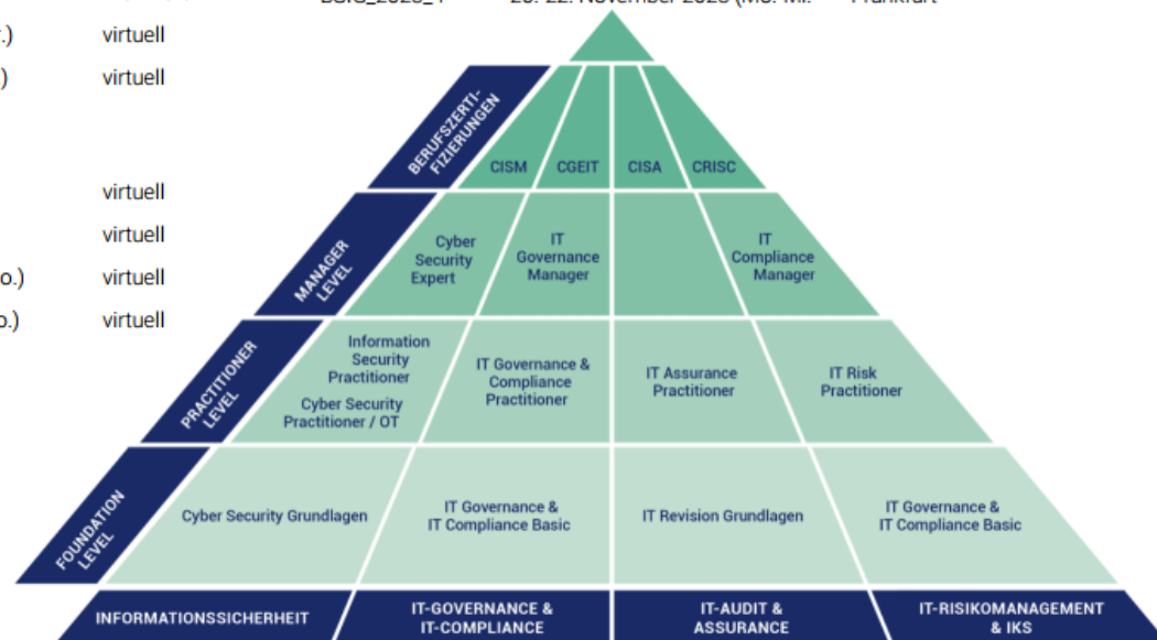
Ausbildungspyramide des ISACA Germany Chapter e. V.