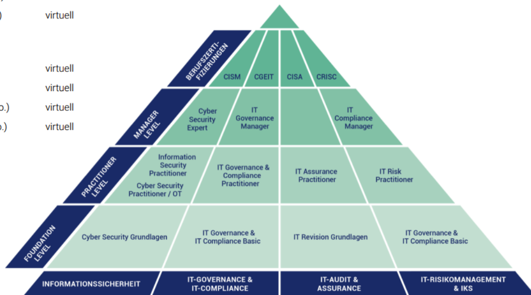
Ausbildungspyramide des ISACA Germany Chapter e. V.